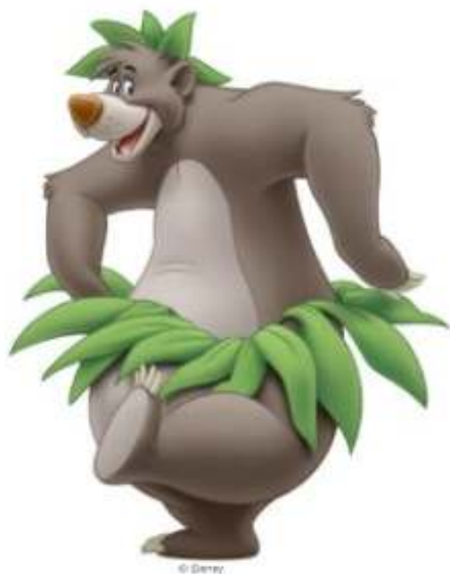
Baloo sparker *biib*/red.

I vil selvfølgelig også få mere information fra os.