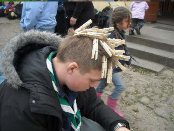
- Tusind tak for sidst, minier ;D