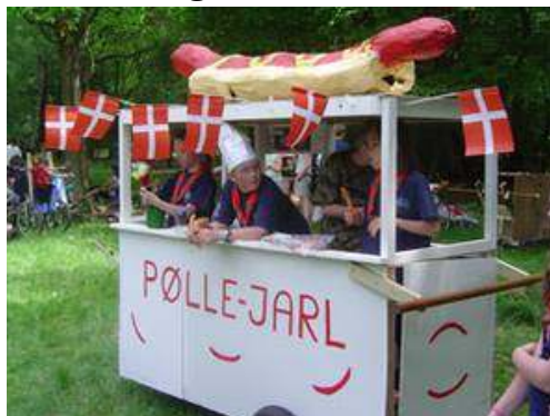
En gammel Oak City Rally (bil?)

Undskyld Trop - men Fruen fra siden før kunne ikke stoppel