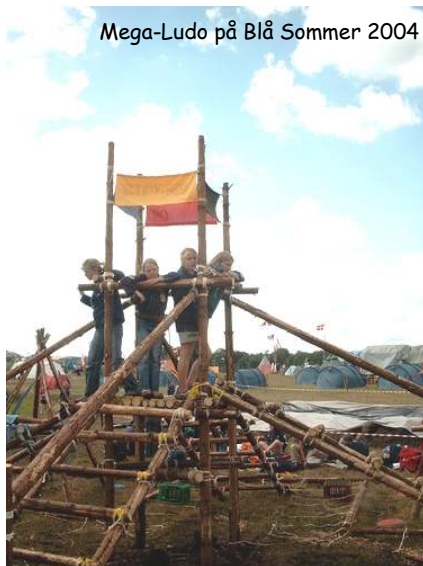
Mega-Ludo på Blå Sommer 2004